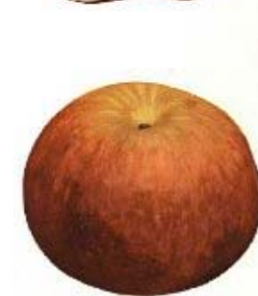
Apple of New York, 1905.